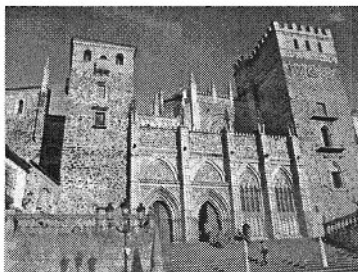
Monasterio de Guadalupe

La Asociación Cívica Extremeña "Virgen de Guadalupe", cuyo objetivo es conseguir que la Patrona de Extremadura, actualmente bajo jurisdicción de la provincia eclesiástica de Toledo, pase a formar parte de la provincia eclesiástica de Extremadura, manifiesta que la adscripción del Monasterio de Guadalupe, y de las 31 localidades extremeñas a una jurisdicción eclesiástica ajena al territorio civil de la Comunidad Autónoma de Extremadura supone, desde el punto de vista religioso, una "anomalía histórica".